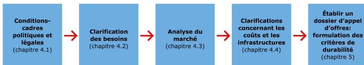
Figure 1: Étapes à considérer avant l'achat

La réussite du projet tient notamment au fait que la commune réfléchisse aux objectifs le plus tôt possible dans le processus de développement des espaces verts, avant même les premiers achats, et qu'elle en détermine la faisabilité: existe-t-il dans la commune des concepts et des décisions pour les espaces verts publics? Quels sont les besoins de la population en ce qui concerne l'espace correspondant, en l'occurrence quelles fonctions l'espace vert doit-il remplir? Comment aménager un espace vert en préservant les ressources et en l'adaptant au site? Dans ce contexte, il est important que l'entretien soit ancré dès le départ dans des concepts (qui entretient l'espace vert et avec quel régime d'entretien).